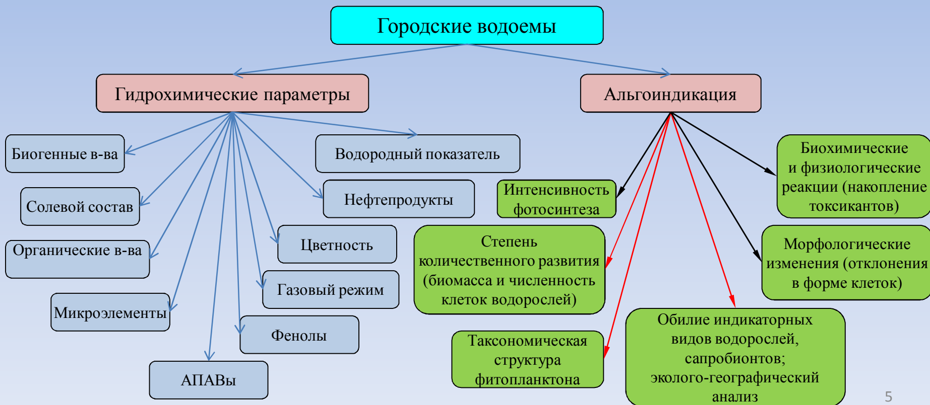
Схема оценки качества поверхностных вод